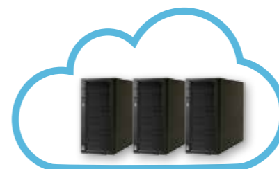
Server Cloud RISCO