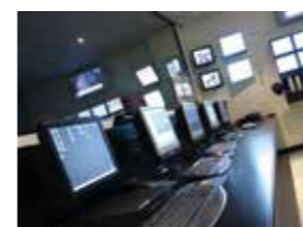
Società di Ricezione eventi